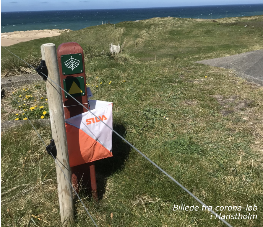
Billede fra corona-løb i Hanstholm

Det har været et meget anderledes og mærkeligt forår. Det begyndte ellers så godt. Velbesøgte Vintertræningsløb, en fin Klubaften om banelægning, en god generalforsamling og