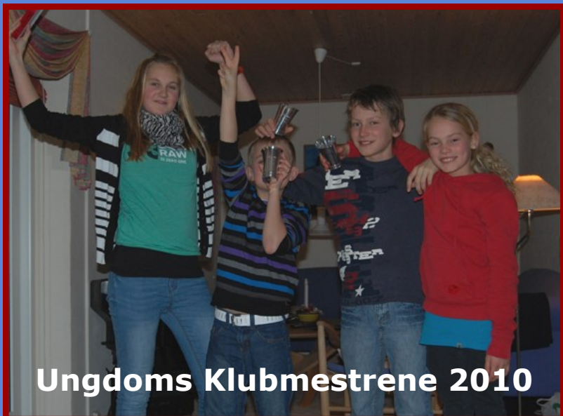
Ungdoms Klubmestrene 2010

De gaml... øh voksne Klubmestre 2010 findes bagerst i bladet :)