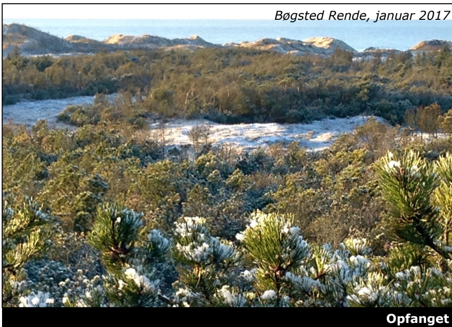
Bøgsted Rende, januar 2017

Nationalpark Thy. Der er altid noget at se på, naturen er aldrig ens der ude. Mit favorit sted er Bøgsted Rende.